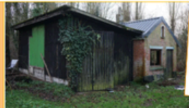
De voormalige demonstratie van de composteerders ligt er al jaren volaan bij D-Kloof Plein

In de Meersstraat in Stekene is de eerste steen gelegd van een woonproject voor volwassenen met een mentale beperking. Het project biedt permanente begeleiding en focus op inclusie.