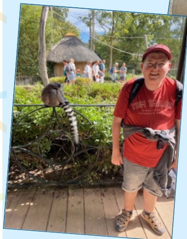
Betekenisvolle, individueel afgestemde dagbesteding