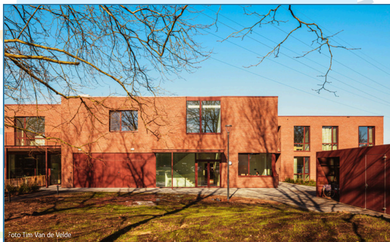
Abingdonstraat Sint-Niklaas: 36 studio's en 3 dagateliërs

Maar wat altijd blijft, is onze betrokkenheid, onze liefde voor de zorg en onze drive om elke dag kwaliteitsvolle ondersteuning te bieden aan onze cliënten. Met die stevige basis kijken we vol vertrouwen vooruit.