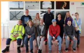
Zwerfvuilhelden van De Klokke op stap in Temse centrum

TEMSE - De begeleiders en gasten van De Klokke vzw gaan regelmatig in het centrum van Temse op pad om zwerfvuil te verzamelen. Een mooi initiatief dat de gemeente graag in de verf zet.