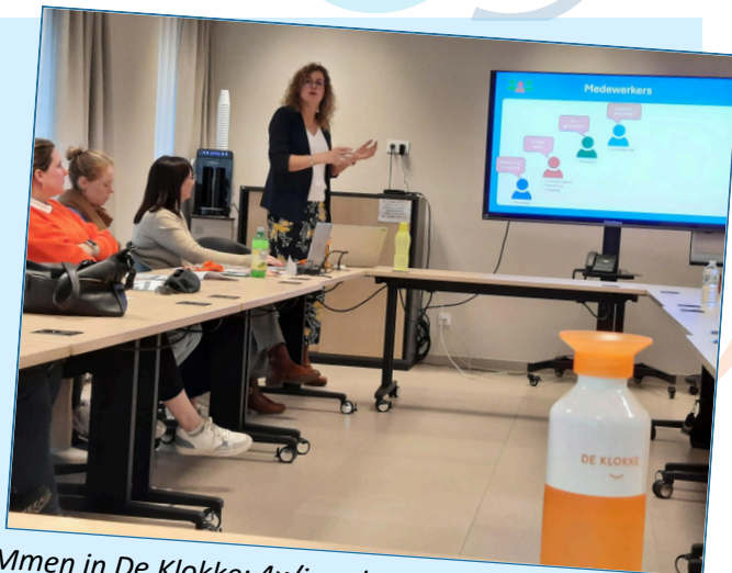
PIMmen in De Klokke: 4x/jaar komen alle medewerkers samen voor een PersoneelsInformatieMoment.