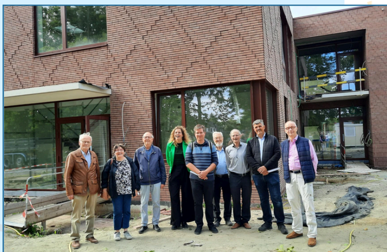
Een tevreden bestuur voor de nieuwbouw in Sint-Niklaas