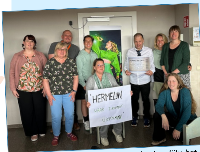
Professionele, gedreven teams die dagelijks het beste van zichzelf geven.

Op 31/12/2025 werken in De Klokke 16 voltijdse en 67 deeltijdse personeelsleden, goed voor 59,7 voltijdse equivalenten. 85 % heeft een overeenkomst van onbepaalde duur.