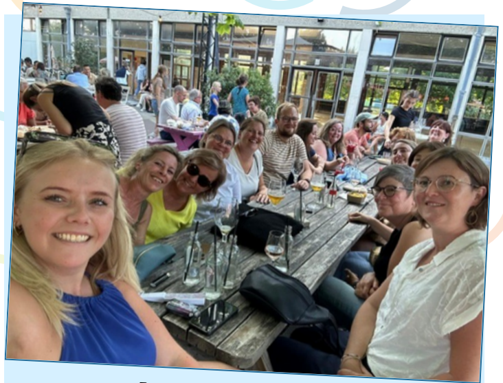
Fun@Work leidt ook tot Fun-after-Work...

Tenslotte wordt de werking van de verschillende teams onder de loep genomen en vertaalt elk team de KERNWAARDEN van De Klokke - inclusief, verbonden, autonoom en duurzaam - naar zijn eigen werking.