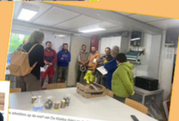
Gebakjes voor arbeiders Grote Markt en De Klokke: "Bedanking voor het werk op de werf"

Kleine boerderij transformeert tot huis voor mensen met beperking: "Het was altijd mijn droom om weer hier te komen wonen"