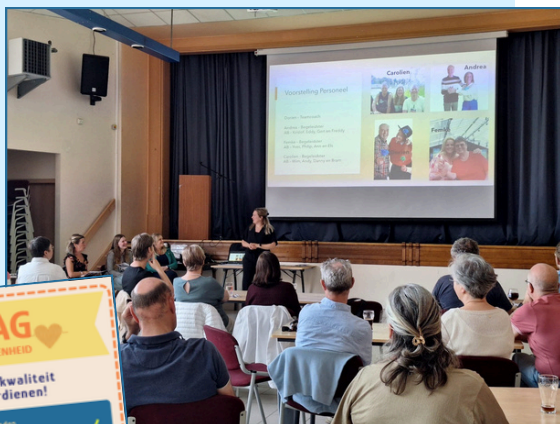
Netwerkmoment in De Voorzet