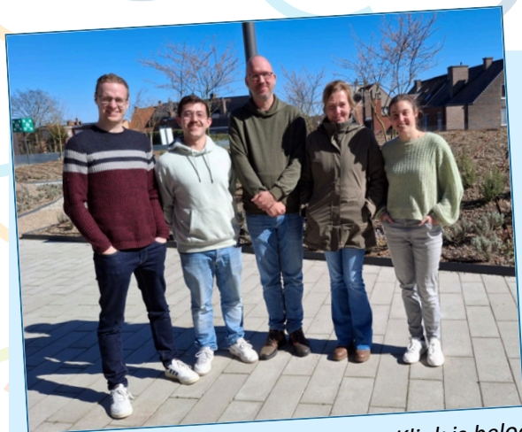
De professionele aanpak van team Klink is beloond met een erkenning van hun RTH-pilootproject.

We verkennen verder de mogelijkheden om uurroosters nog efficiënter op te maken, met aandacht voor zowel WERKBAARHEID , als INSPRAAK van medewerkers. En ook het arbeidsreglement krijgt een update.