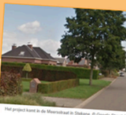
Het project komt in de Meersstraat in Dikene.

TEMSE - De begeleiders en gasten van De Klokke vzw gaan regelmatig in het centrum van Temse op pad om zwerfvuil te verzamelen. Een mooi initiatief dat de gemeente graag in de verf zet.